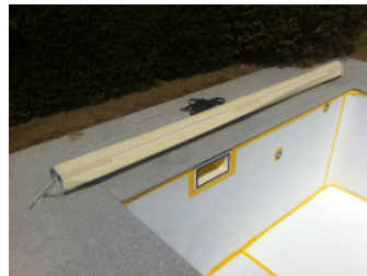
Schutzfilz Wand + Boden