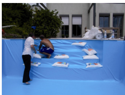
Zum Füllen mit Sandsäcken beschweren