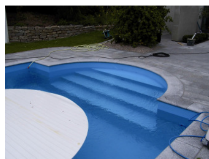
Treppe schön integriert, keine unschönen Treppenflansche nötig