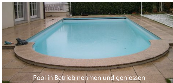
Pool in Betrieb nehmen und geniessen