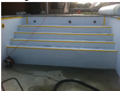
Schutzfilz auf Treppe